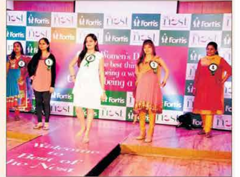
1) ಬಿ-ಪ್ಯಾಕ್ ನಗರದ ಕಂಠೀರವ ಕ್ರೀಡಾಂಗಣದಿಂದ ಸ್ವಾತಂತ್ರ್ಯ ಉದ್ಘಾಟನದವರೆಗೆ ಆಯೋಜಿಸಿದ್ದ 'ಭದ್ರತೆ ಒದಗಿಸಿ ಚಾಥಾ'ದಲ್ಲಿ ಯುವತಿಯರು ಪಾಲ್ಗೊಂಡರು 2) ಆಸರೆ ಟ್ರಸ್ಟ್ ಪತಿಯಿಂದ ನಡೆದ ಕಾರ್ಯಕ್ರಮದಲ್ಲಿ ರೆಜೋ ಮ್ಯೂಸಿಕ್ ಸ್ಟಾರ್ಕ್ ಮಹಿಳಾ ಸಂಗೀತ ತಂಡ ಗಾಯನ ಪ್ರಸ್ತುತ ಪಡಿಸಿತು 3) ಮಹಿಳಾ ಮತ್ತು ಮಕ್ಕಳ ಅಭಿವೃದ್ಧಿ ಇಲಾಖೆಯ ಅಂತರರಾಷ್ಟ್ರೀಯ ಮಹಿಳಾ ದಿನಾಚರಣೆ ಅಂಗವಾಗಿ ಶನಿವಾರ ಏರ್ಪಡಿಸಿದ್ದ 'ಮಹಿಳಾ ಪ್ರಗತಿ ಪರ ಚಿಂತನಾ ಕಾರ್ಯಾಗಾರ'ದಲ್ಲಿ ಕಾರ್ಯಕ್ರಮದಲ್ಲಿ ಚಾಮುಂಡೇಶ್ವರಿ ಸ್ತ್ರೀ ಶಕ್ತಿ ಸಂಘದ ಸದಸ್ಯರು ನೃತ್ಯ ಪ್ರದರ್ಶಿಸಿದರು 4) ಬನ್ನೇರುಘಟ್ಟ ರಸ್ತೆಯಲ್ಲಿರುವ ಫೋರ್ಟಿಸ್ ಆಸ್ಪತ್ರೆಯ 'ದಿ ನೆಸ್ಟ್' ಪ್ರಸೂತಿ ಕೇಂದ್ರದಲ್ಲಿ ಗರ್ಭಿಣಿಯರು ರಾಂಪ್ ಮೇಲೆ ಹೆಜ್ಜೆ ಹಾಕಿದರು